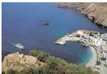
GOLE DI SAMARIA