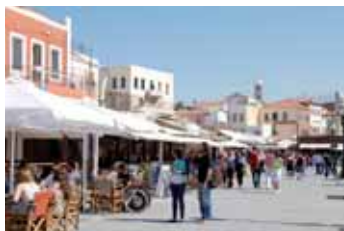
CHANIA - RETHYMNO