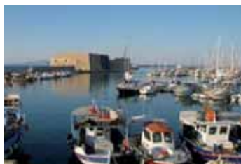
KNOSSOS - IRAKLION